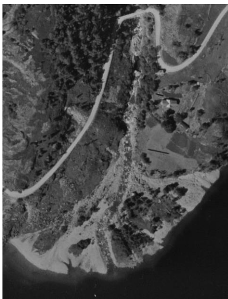
1948 Flyfoto Håra 00304_003.

Kort bildehistorikk, flyfoto: 2 stk fra før utbygginga og et fra i dag, etter plastringa i 2021.