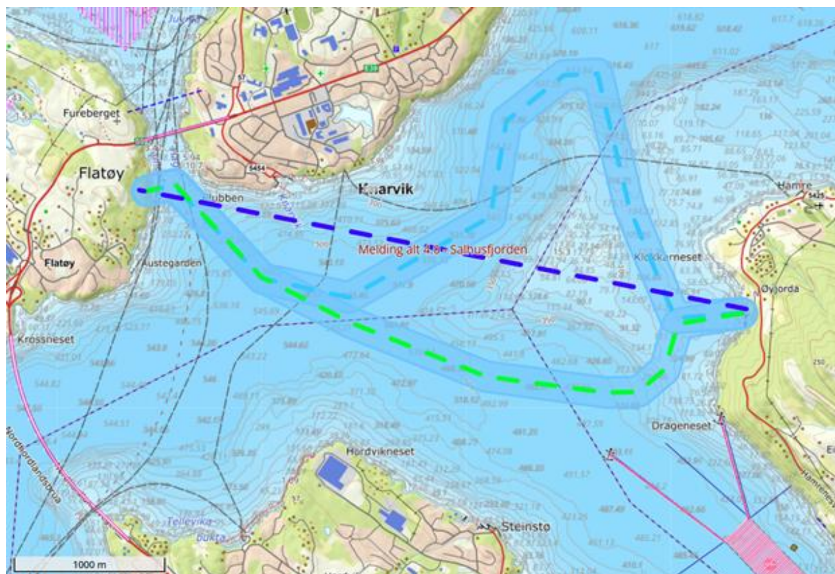
Figur 2: Mørkeblå stiplet linje viser avstand i luftlinje mellom Øyjorda og Flatøy (ca. 4 km) som vist i melding. Faktisk sjøkabeltrasé må tilpasses terrenget på sjøbunnen. To potensielle traséer er vist i lys blå (ca. 7 km) og grønn (ca. 5,5 km) er bedre tilpasset terrenget i fjorden.

Ved kryssing av Salhusfjorden er forholdene i sjøen svært krevende. Fjorden er svært dypt med vanddyp på 550-600 m, og det er bratt undervannsterreng på begge sider av fjorden. I skråningene vil det være vanskelig å finne plass til å legge ni en-lederkabler stabilt grunnet bratt og kupert undervannsterreng. Nedgraving av kablene i disse områdene vurderes derfor som lite realistisk, og kablene må derfor i stor grad forventes å bli liggende eksponert på sjøbunnen.