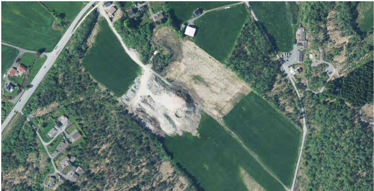
Figur 2 viser bilde av riggplassen.