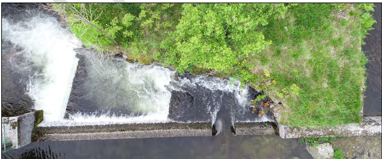
Figur 4. Fisketrappen på utløpet av Lillevatnet på middels vannføring.

Fisketrappen er gunstig utformet og voksen laks og ørret kan vandre gjennom trappen på de fleste vannføringer. På stor vannføring kan de også hoppe direkte over dammen, da høydeforskjellen kun er ca. 1 m på middels vannføring ( figur 4 ). Trappen kan også passeres av ål og ung laks og ørret, men spesielt ål vil trolig måtte vente på relativt lav vannføring for å kunne vandre opp. Trappen vil også fungere ved minstevannføring på 180 l/s, men det er ikke sikkert at dette er tilstrekkelig vannføring til å motivere voksen laks og sjørret til oppvandring.