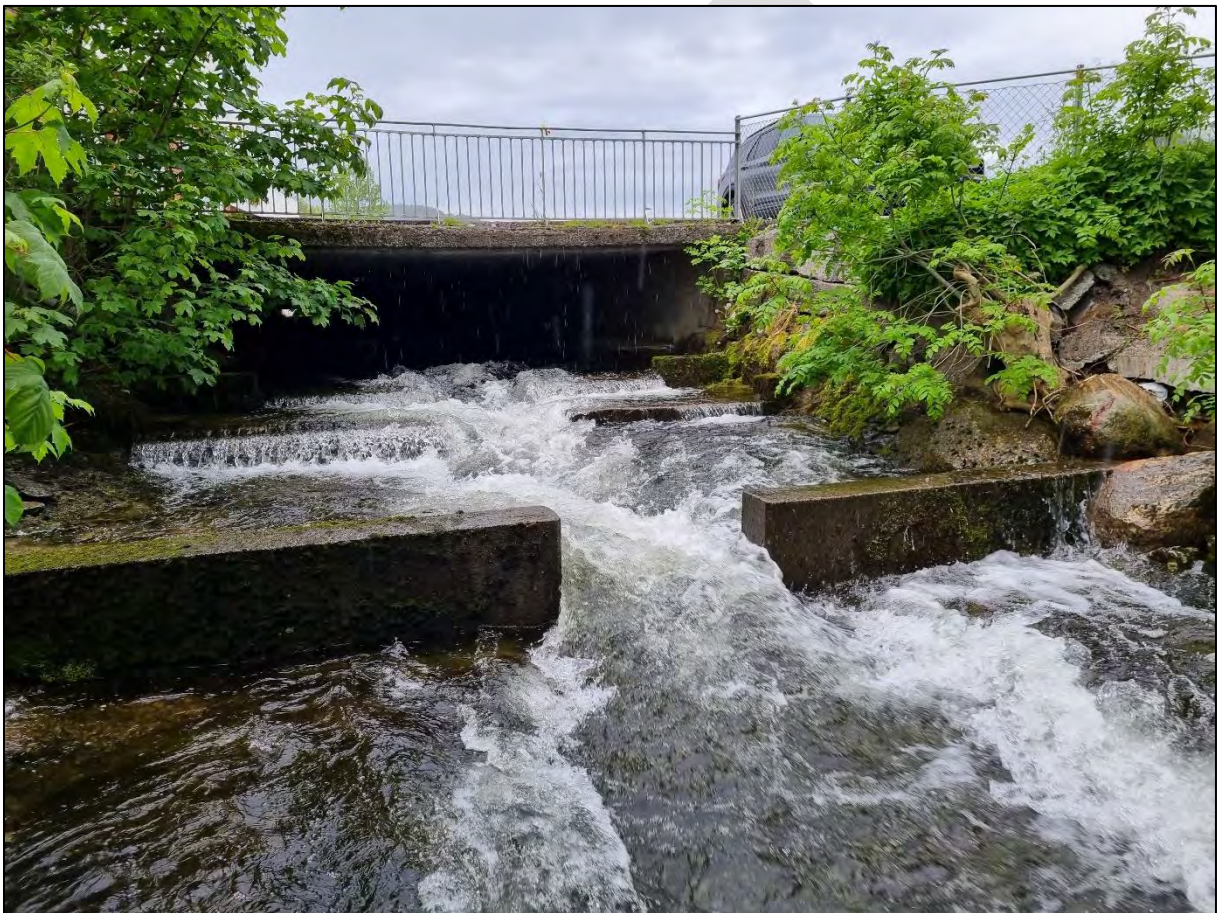
Figur 5. Fisketrappen ved kulverten under Kiwi, på middels vannføring.

Ved siden av dammene på utløpet av Brusdalsvatnet og Lillevatnet, er det kun én flaksehals for fiskevandring: kulverten under Kiwi. Mesteparten av kulverten har relativt slak helning og naturlig substrat, og kan lett svømmes gjennom på de fleste vannføringer. Nedre del er brattere og har betongbunn, samt en kort fisketrapp med tre trinn like nedstrøms kulverten ( figur 5 ). Trappen fungerer sannsynligvis ok, selv om spaltene i hvert trinn helst skulle vært forskjøvet horisontalt relativt til hverandre. Overgangen fra trapp til kulvert, med bratt og slett betongbunn, er det mest utfordrende punktet. Oppvandring vil her være vanskeligst på de laveste vannføringene, og det er usikkert om laks og sjøørret vil komme seg forbi dette punktet på 180 l/s. Vi anbefaler at eksisterende trapp utvides med flere trinn innover i kulverten. Dette kan gjennomføres ved å bolte L-profiler eller trevirke ned i betongbunnen, med lavvannsrenne vekselvis på høyre og venstre side av kulverten.