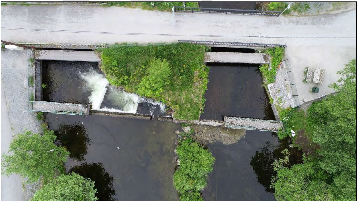
Figur 3. Dammen på utløpet av Lillevatnet. Vannføringen ut av innsjøen deles mellom Spjelkavikelva (til venstre) og «Kanalen» (til høyre), og kan reguleres ved hjelp av manuelt styrte luker. Fisketrappen forenkler fiskevandring over dammen.