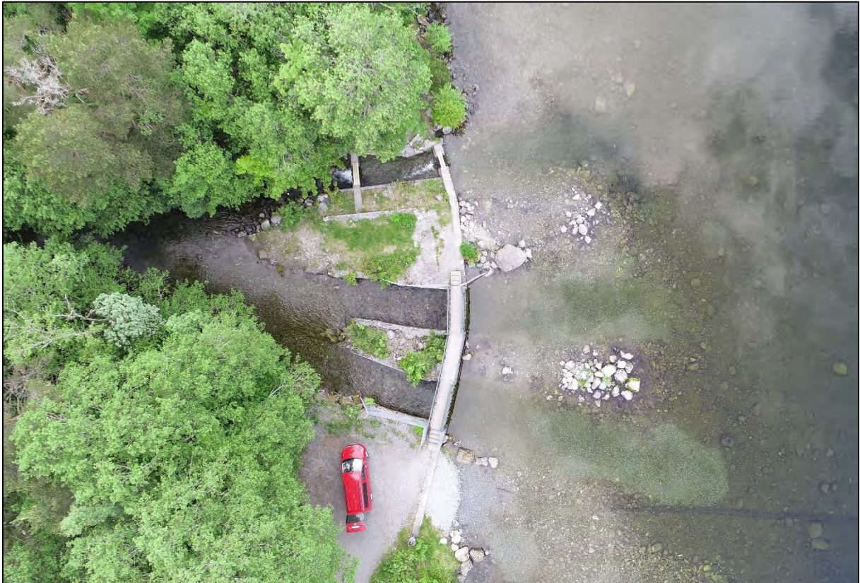
Figur 2. Dammen på utløpet av Brusdalsvatnet. Vannføringen ut av innsjøen reguleres ved hjelp av to manuelt styrte luker i de to løpene nærmest den røde bilen, mens det tredje løpet er en omløpsbekk for fiskevandring.