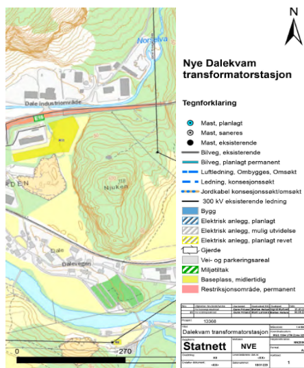
Figur 2 Riggområde R11 ved Dalegården markert med gul polygon.