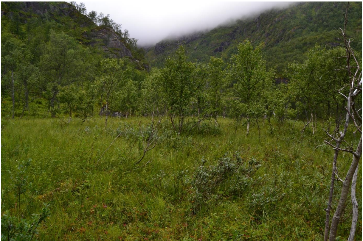
Bilde 4 og 5. Beitemark og mulig gammel slåtte-mark på sørsida av Gullvikvatnet.