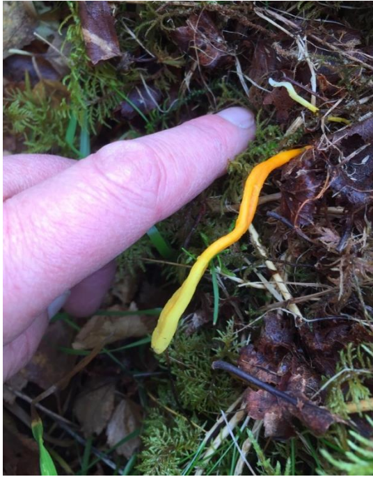
Bilde 6. Bildet viser sopp fra beitepåvirka utmark som ligger nær til naturbeitemarka. Arten er enten gul småkøllesopp ( Clavulinopsis helvola , mest på sur mark, relativt vanlig over hele landet) eller rødgul småkøllesopp ( Clavulinopsis laeticolor ). Arten kan bare bestemmes ved mikroskopering. Jordal, Jon Bjarne 2019.