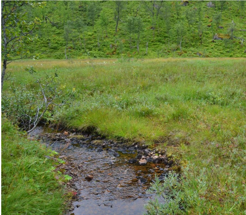
Bilde 2. Bekken som kommer fra nedslagsfeltet i fjellområdet og inn i myra og renner ut i vestre del av Gullvikvatnet.