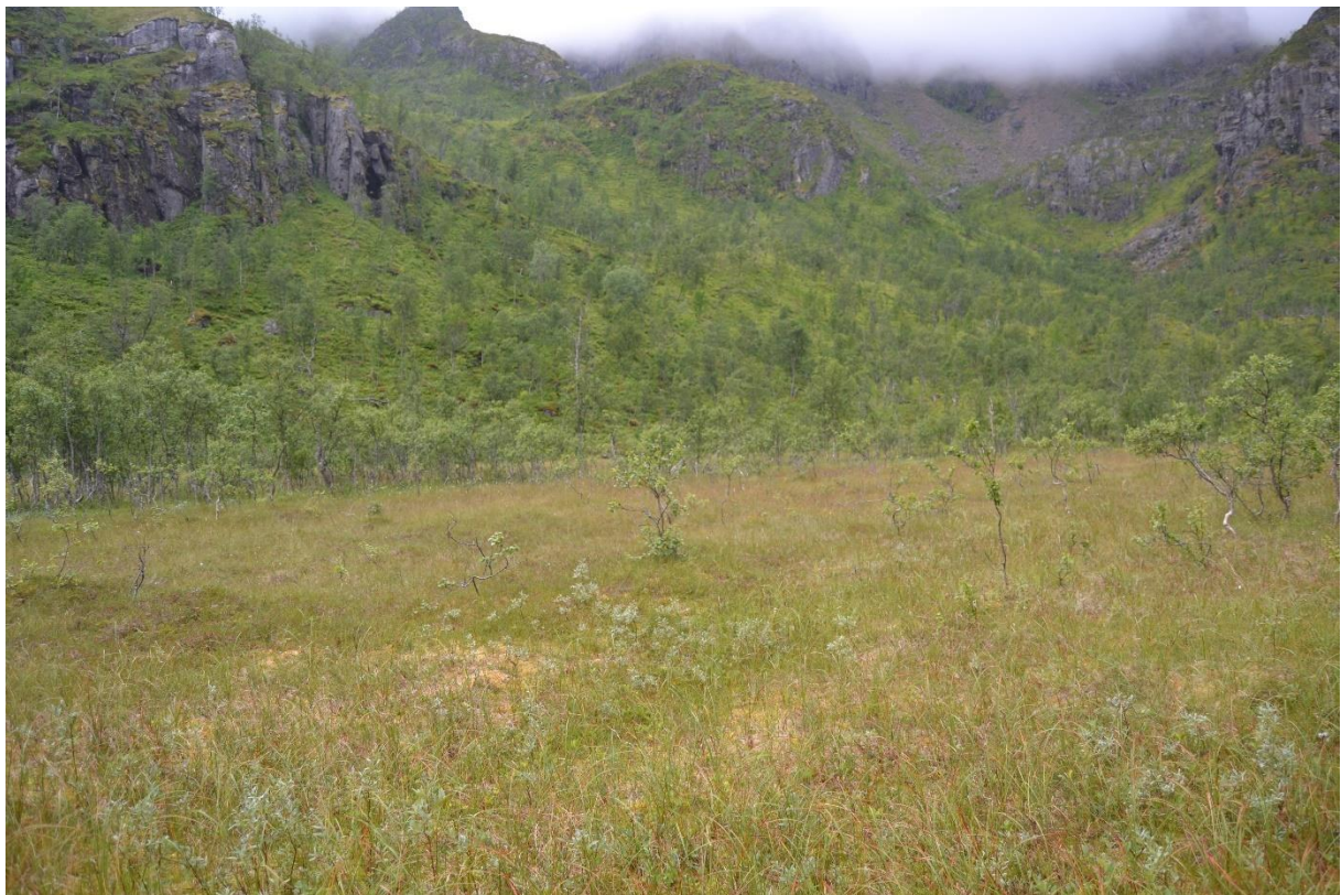
Bilde 1. Bildet viser det flate myrområdet i vestre del av Gullvikvatnet.