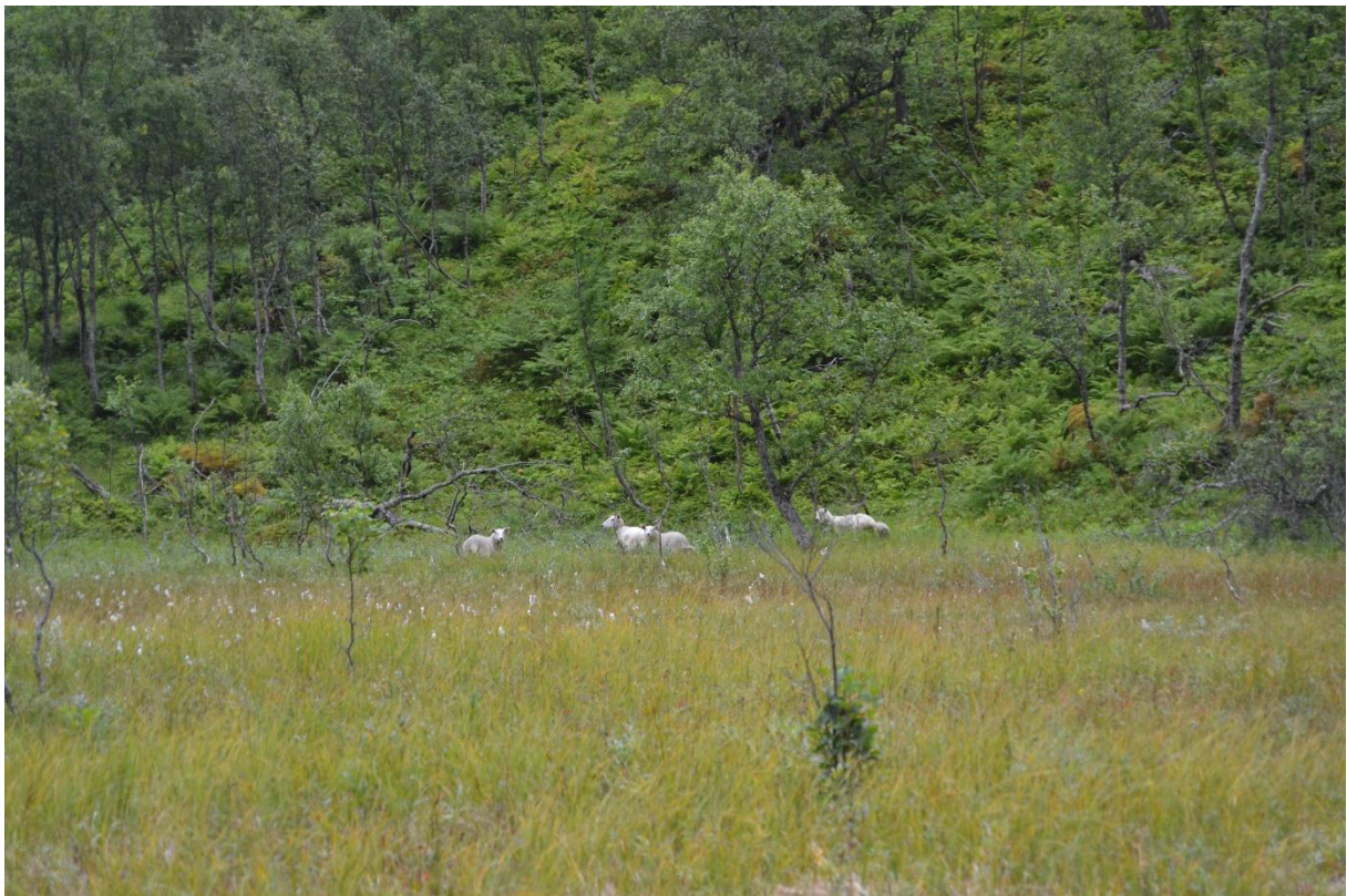
Bilde 3. Sau på beite ved Gullvikvatnet.