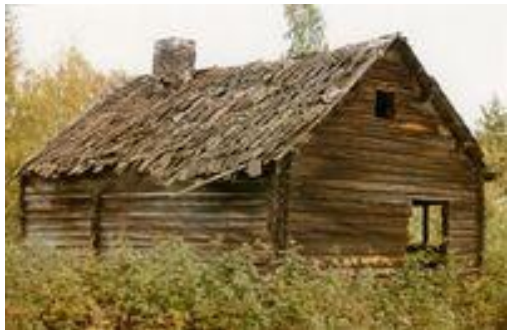
Bolighuset slik det så ut i 1985