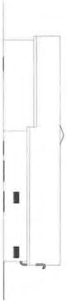
Fasade D 1 : 300