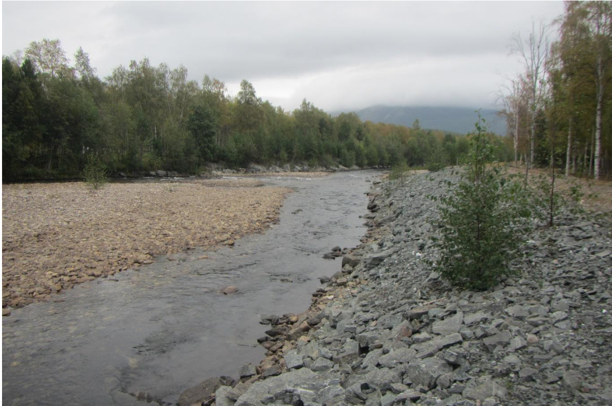
Figur 6. Yttersving forsterket med sprengstein.

høy vannhastighet, laminær strøm, lite skjul og standplasser for de ulike årsklasser og størrelser av fisk. Forbygningen på begge sider av elven er stedvis fylt opp med finsubstrat og gir få muligheter for skjul.