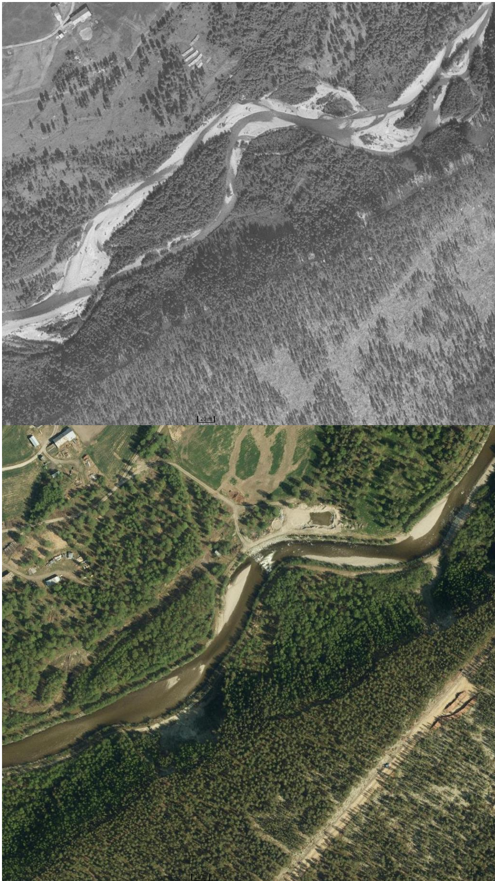
Figur 9. Detaljbilde fra 1969 (øverst) og 2018 (nederst) som viser forskjellen mellom en forbygd elv med terskel og en mer naturlig elv, der det dannes flømløp og meandre.