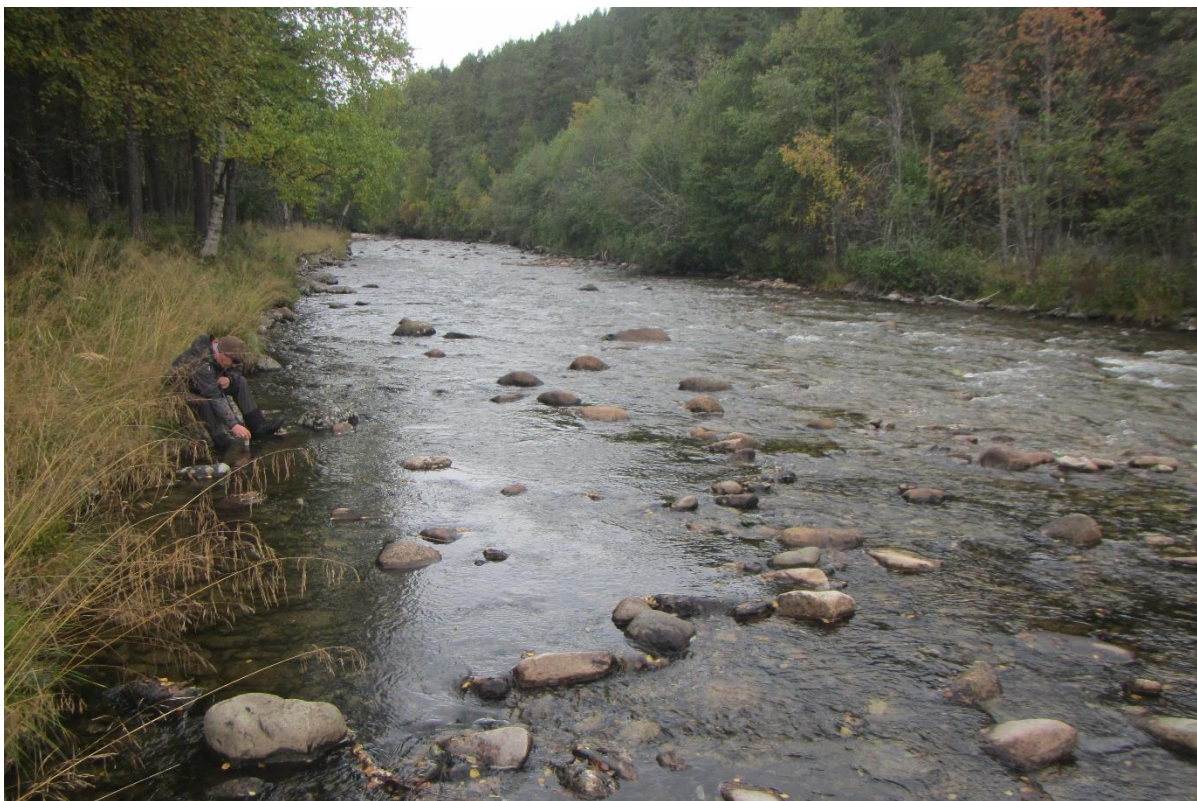
Figur 2. Oversiktsbilde over stasjon 1, sett oppover elva. Stasjonen ligger ovenfor regulert område.