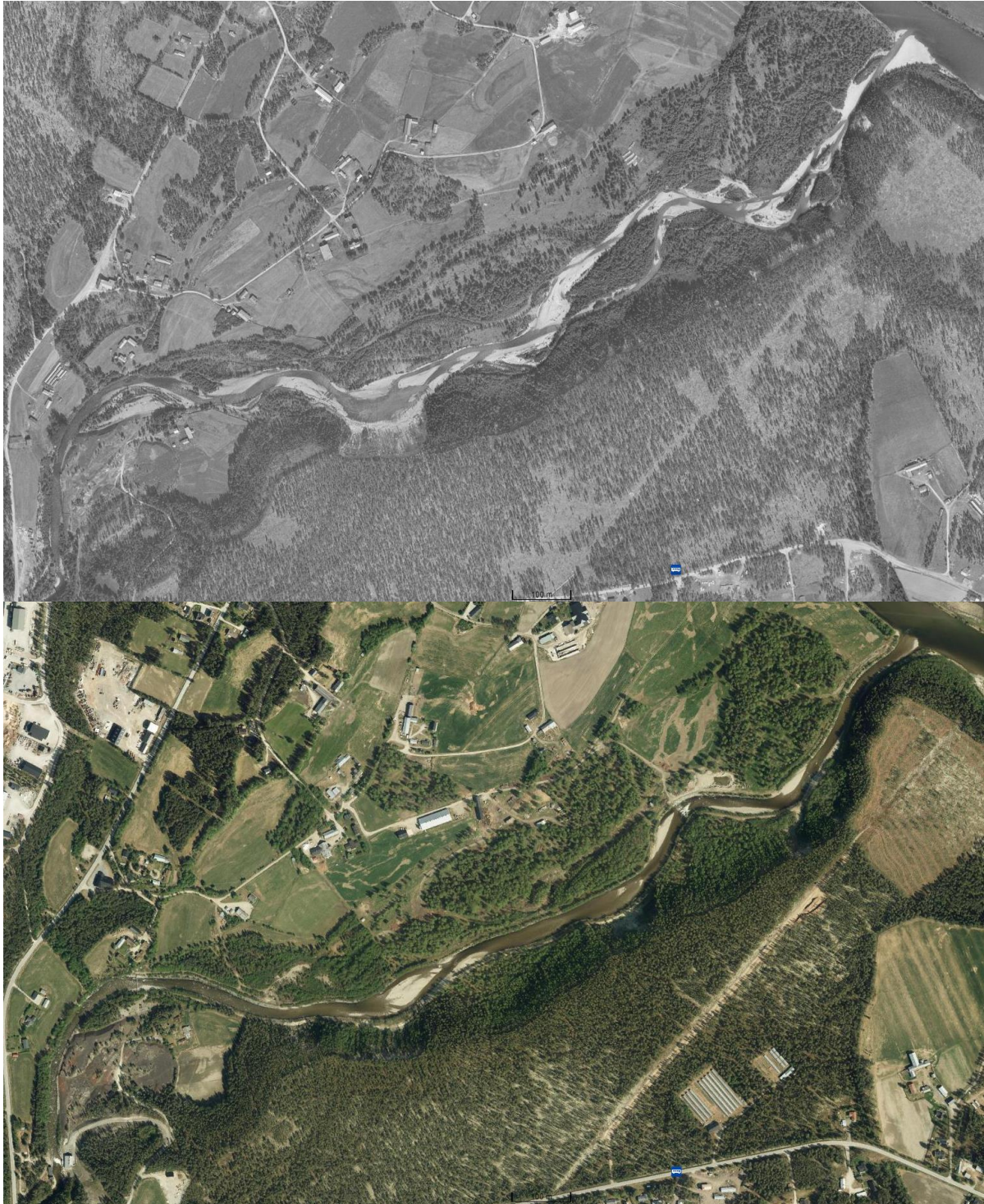
Figur 8. Oversiktsbilde fra 2018 (øverst) og 1969 (nederst) over tilgjengelig område for fisk fra Folla og Glomma. Det nye kraftverket kan skimtes i overkant av slagghaugene i nedre venstre hjørne av bildet. Bildet fra 1969 viser Sølva antagelig etter at den brøt igjennom forbygningene under storflommen i 1967, og viser en mer naturlig elvedynamikk på en elveslette.