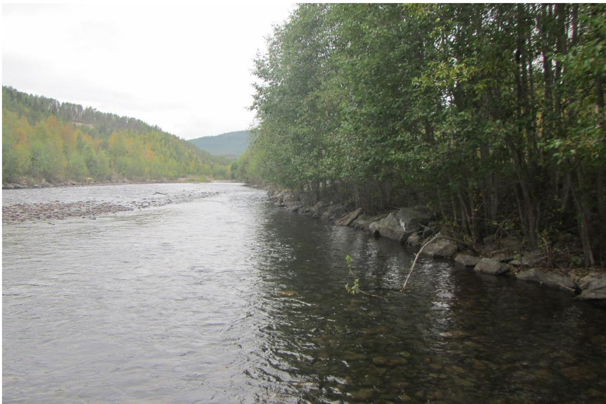
Figur 4. Oversiktsbilde over Stasjon 4, sett oppover elva. Stasjonen ligger nedenfor kraftverksutløpet.