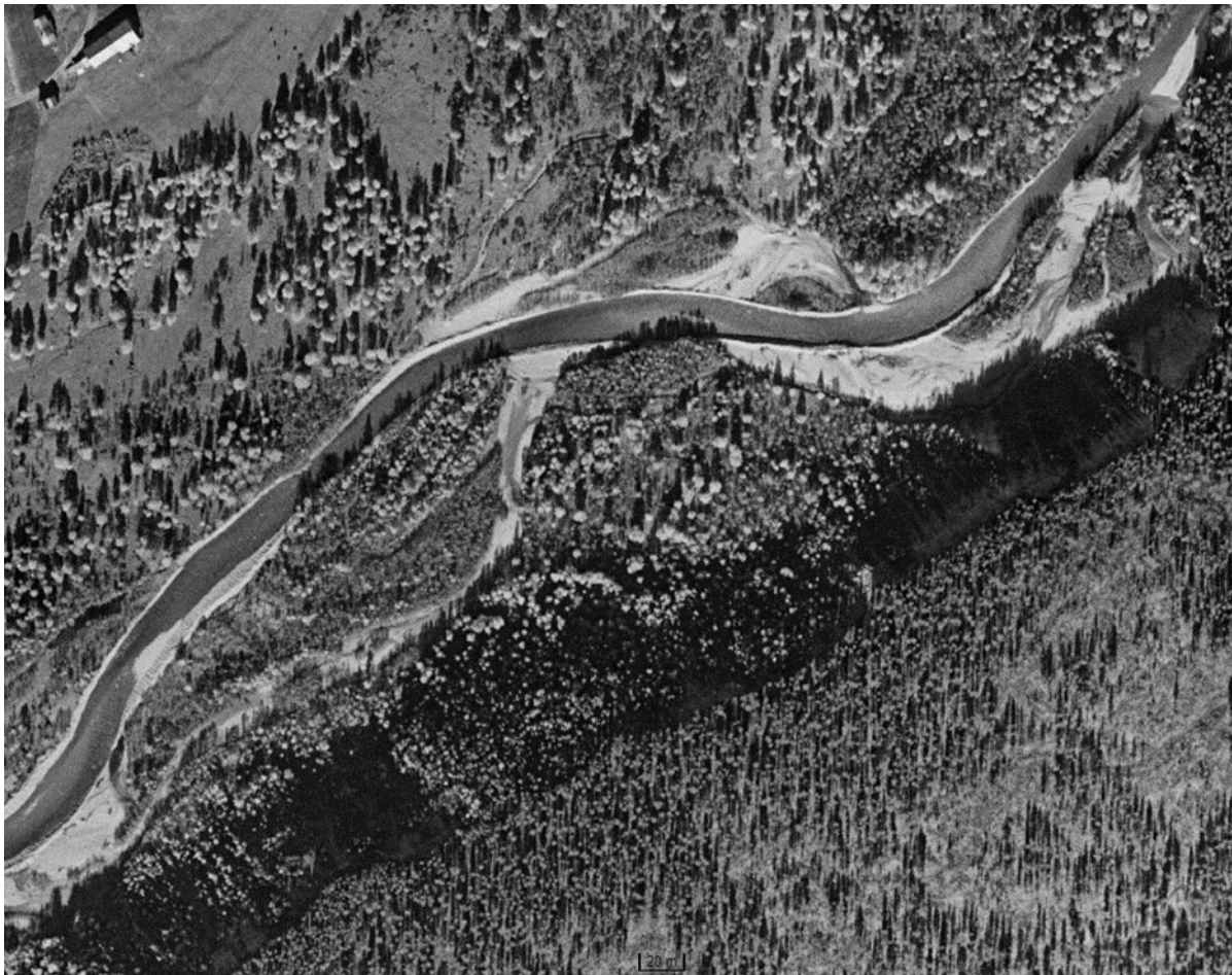
Figur 5. Flybilde fra 1961 over samme område som figur 8. viser en forbygd elv med gamle flomløp synlig.

De nedre delene av Sølva, tilgjengelig for fisk fra Glomma og Folla, er sterkt påvirket av menneskelig aktivitet over en lang periode. Flyfoto fra 1961 viser en kanalisert elv, men med fortsatt tydelige flomløp (Figur 5). Det er naturlig å tenke seg at det er gjort tiltak i forbindelse med fløtningen for å hindre tømmervaser, men dette har jeg ikke lyktes å finne dokumentasjon på. Tømmerfløtningen i Sølva ble avsluttet etter 1950 sesongen (Anno museum).