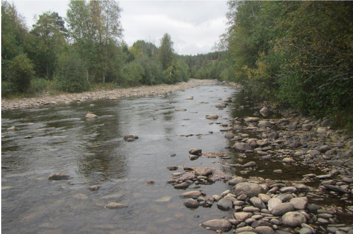
Figur 3. Oversiktsbilde over Stasjon 2, sett oppover elva. Stasjonen ligger på minstevannføringsstrekket (bildet viser vannstand ved 600 l/s). Her ble det observert ørret som ble skremt ut av stasjonen.