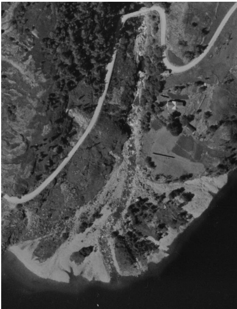
1948 Flyfoto Håra 00304_Ø03

Bildene i dette dokumentet er utklipp fra disse og fra norgebilder.no (1971, 2003, 2006, 2010 og 2013).