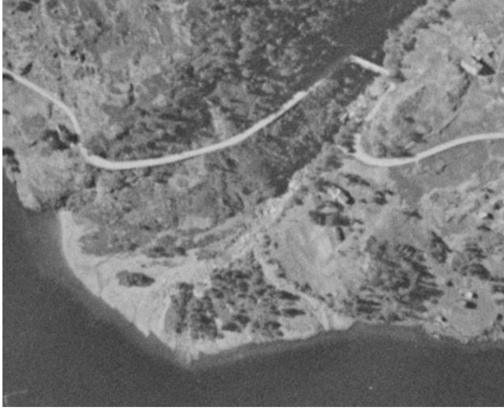
1955 Flyfoto Håra WF-0709_B-04