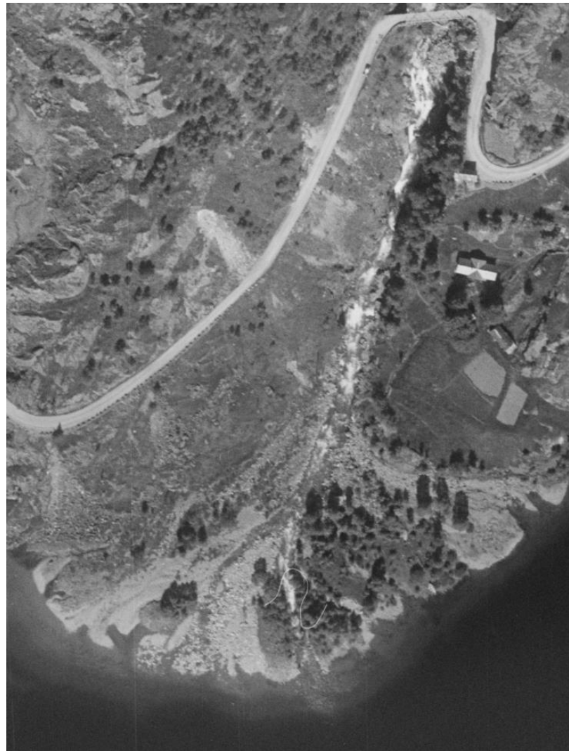
1952 Flyfoto Håra 485_A-5