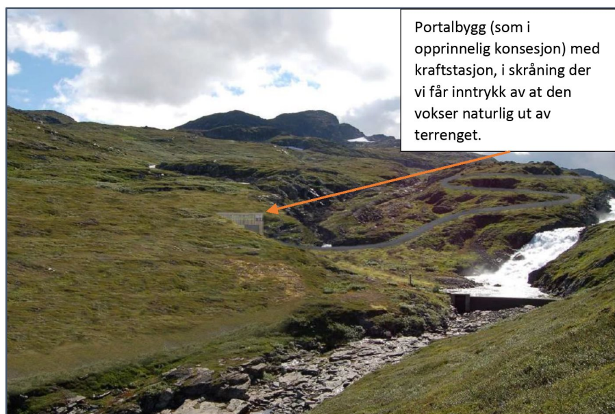
Fig 4-2 fra planendringssøknad Gravdalen Kraftverk - Multiconsult