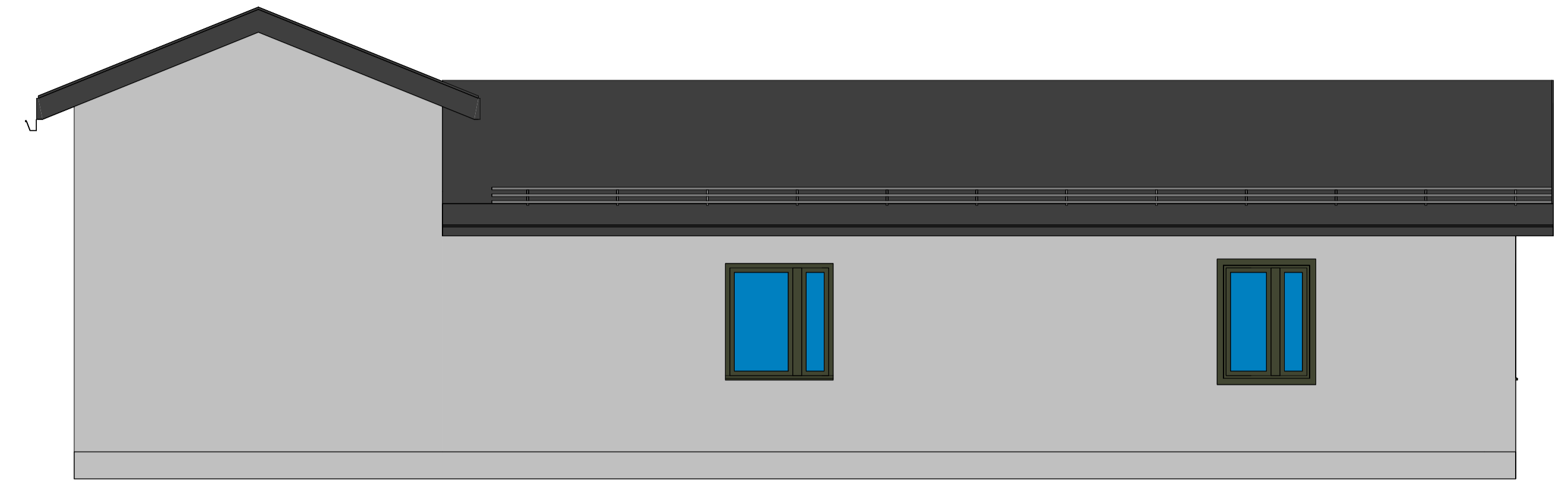
Fasade mot Sør 1:50