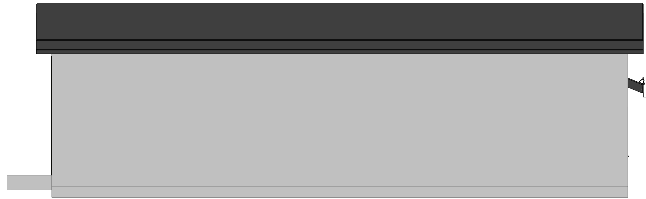
Fasade mot Vest 1:50