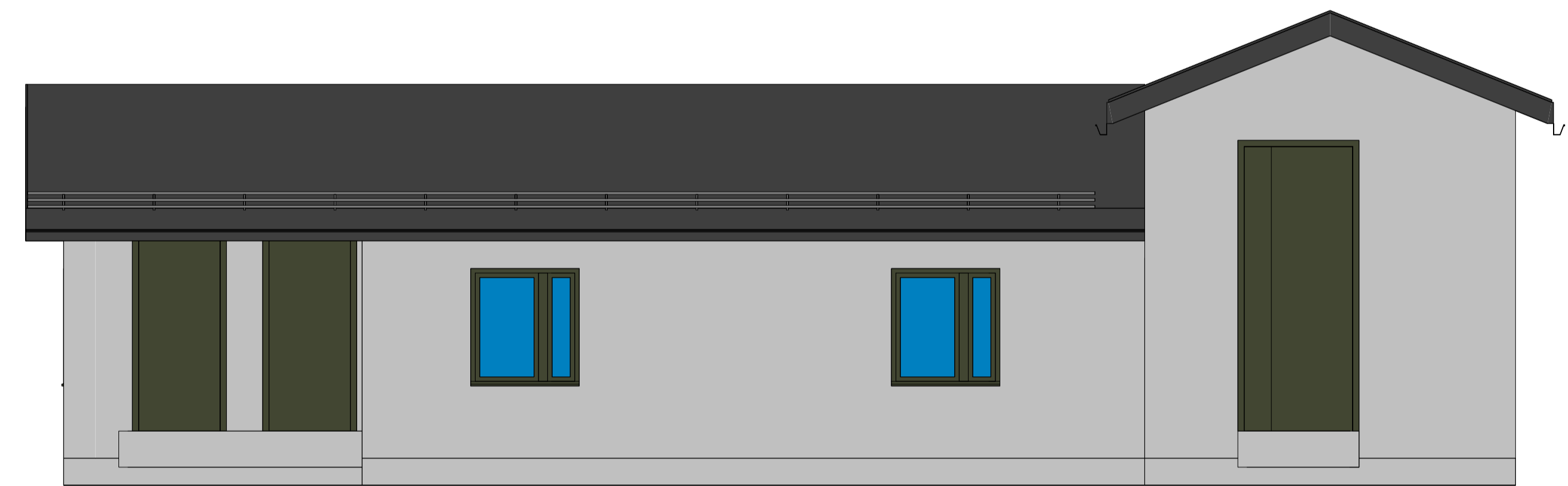
Fasade mot Nord 1:50