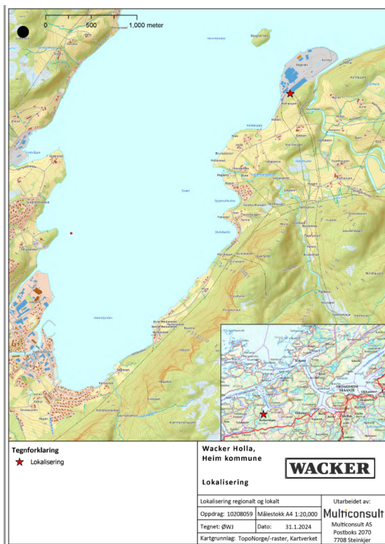
Figur 1: Oversiktskart av Wacker industriområde med plassering av Holla transformatorstasjon, vist med rød stjerne.

Utvidelsen av Holla transformatorstasjon har en kostnadsramme på ca. 50-70 millioner kroner eks. mva.