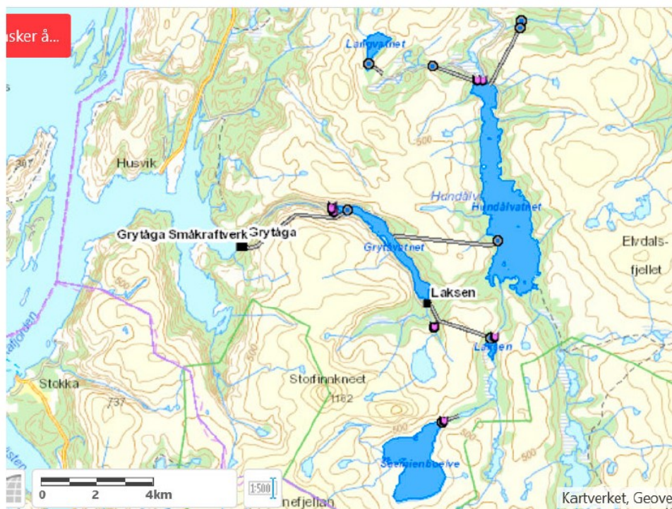
Figur 1: Reguleringer og overføringer i Grytåga-systemet.