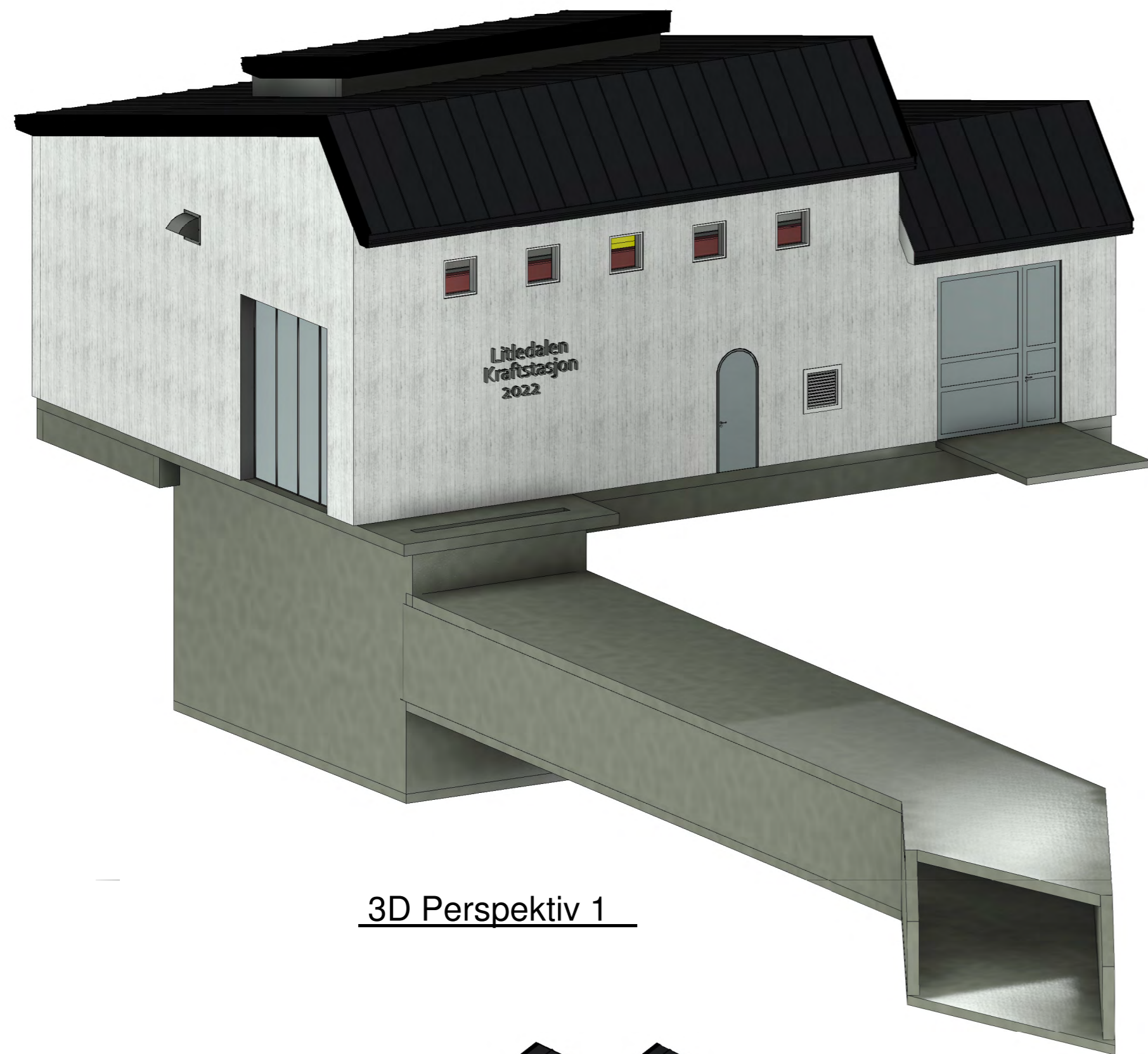
3D Perspektiv 1